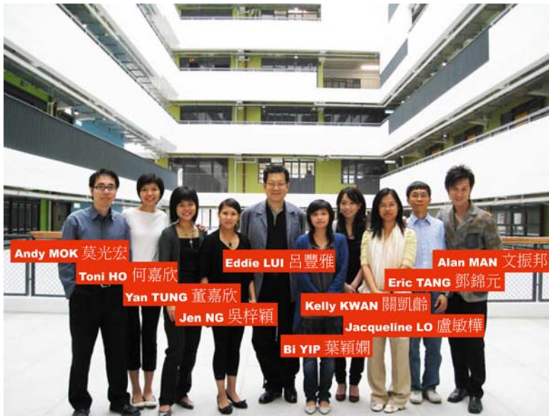
↑ 賽馬會藝術中心服務團隊 The Management Team