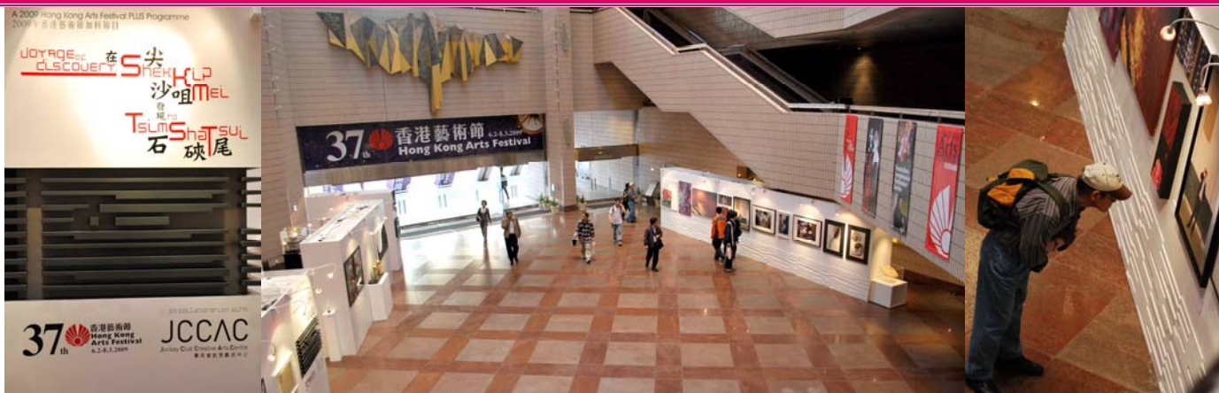
2009年香港藝術節加料節目